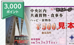
区内共通買物・食事券 (500円×6枚)