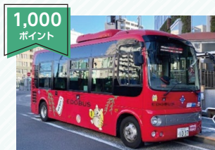
江戸バス回数券 (11回分)